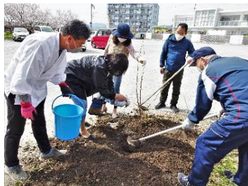
護国神社の桜植樹に参加