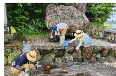
ナツボラ 2023 in 護国神社