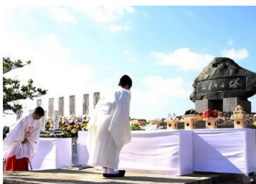
沖縄土佐之塔での慰霊祭に参加