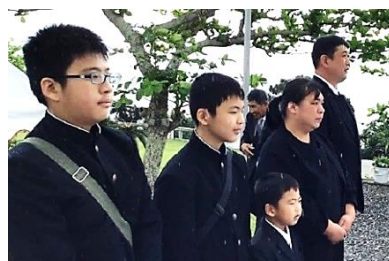
土佐之塔にて、ひいおいちゃんに想いを馳せる