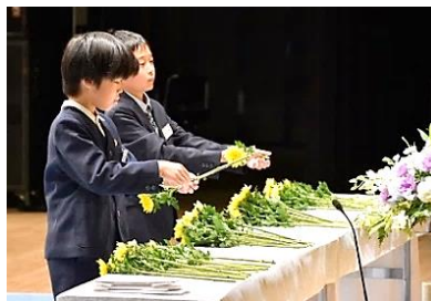
高知県戦没者追悼式 ひ孫世代の献花