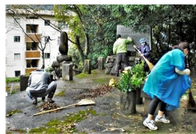
忠霊塔清掃活動 in 四万十市具同