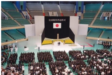
全国戦没者追悼式