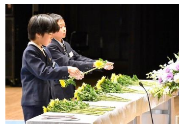
高知県戦没者追悼式 ひ孫世代の献花