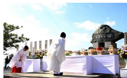
県出身南方戦域戦没者を祀る「土佐之塔」