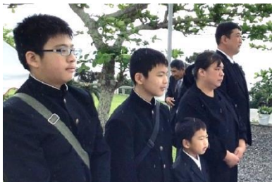
沖縄にて、ひいおしちゃんに想いを馳せる