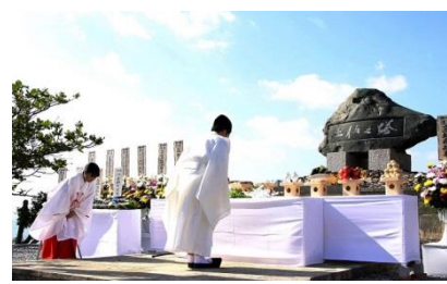
県出身南方戦域戦没者を祀る「土佐之塔」