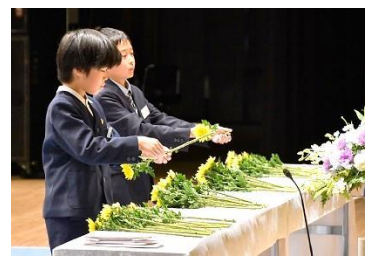
高知県戦没者追悼式 ひ孫世代の献花